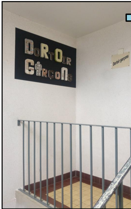
Pancarte d'accueil de l'internat

Quelques nouveautés : Une grande pancarte en lettres 3D, un tapis XXL pour se déchausser à l'entrée, un mur d'expression libre... A bientôt